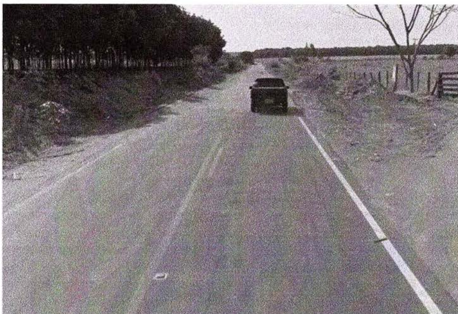
Figura 1- Ponto de término do asfalto na TAB-170

ANEXO – imagens e localização (Google Maps) ponto em que termina a via asfaltada TAB 170 Bairro da Estrela.